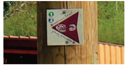
balise trail du Morvan

Pendant la presque totalité du parcours on va suivre les balises du PR Chemin de la Justice parfois doublées par celles du Trail du Morvan