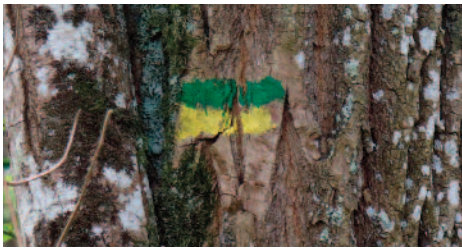
balise PR Chemin de la Justice