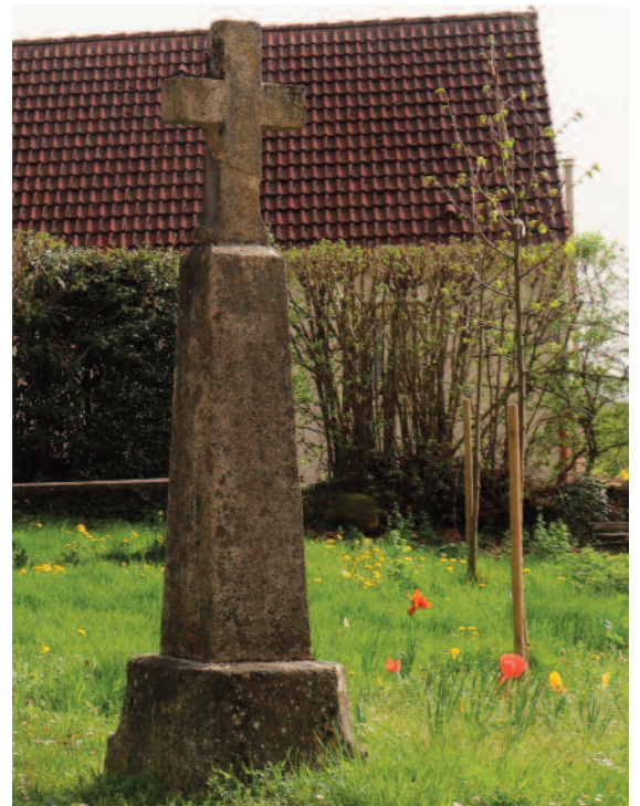
Croix de pierre avant Centre Medico Pédagogique

On débouche sur une départementale (D 42) assez passante. Partir à droite et la suivre sur environ 650 m puis prendre à gauche un bon chemin avant les maisons (balises). Après 700 m il débouche sur une route qu'on traverse pour prendre la rue en face en laissant à droite une croix de pierre (balises du PR et du Trail). Passer près des bâtiments du Centre Médico Pédagogique. On arrive à proximité de la déchèterie communale et d'un pylône téléphonique. Laisser la rue et partir à droite sur le bon chemin en forêt. Tout droit sur 900 m. On débouche sur une petite route. On quitte provisoirement l'itinéraire du PR et du Trail et on part à droite pour 500 m d'abord sur cette petite route puis sur la départementale jusqu'au lieu dit La GrangeBillon. Tout de suite après une maison portant la plaque « Maison des Cailloux » prendre à gauche un bon chemin en descente. Le suivre sur 700 m (au passage joli lavoir rural). Puis on arrive sur un chemin où l'on retrouve les balises du PR et du Trail. 200 m plus loin laisser le Trail partir tout droit et prendre à gauche le chemin avec une balise PR. Désormais on suit ces balises qui ramènent à l'étang du Goulot et au point de départ.